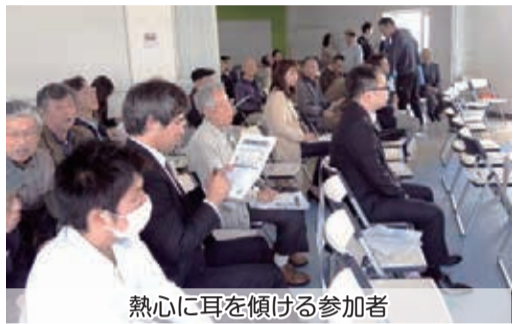
熱心に耳を傾ける参加者

振り返れば、昨年2月に日の里コミュニティセンターでのシンポジウム開催時は、CoCokaraひのさとには全くありませんでした。その後多くの方々のご支援を頂き8月7日(日)にオープンした当館は、現在学生さんや買い物客、バス待ちの2300人程度の方にご利用頂いています。