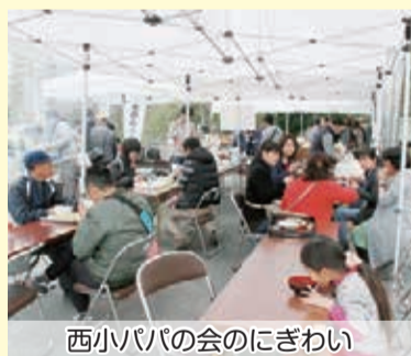
西小パパの会のにぎわい