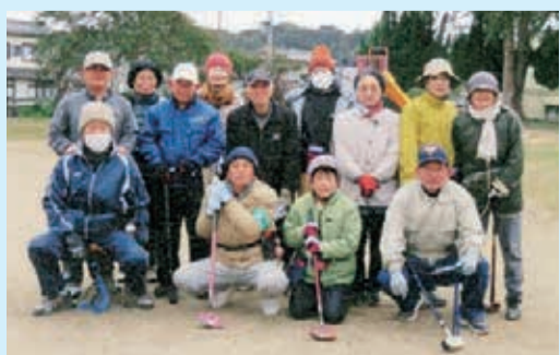
さくらクラブ広報担当

会員は20人いますが、1月16日(月)の練習は極寒の朝でしたが13人の参加者で元気に楽しそうにゲームをされていました。(本日に寒い朝でした)グラウンドゴルフ会員の皆さんは若くて?元気です!