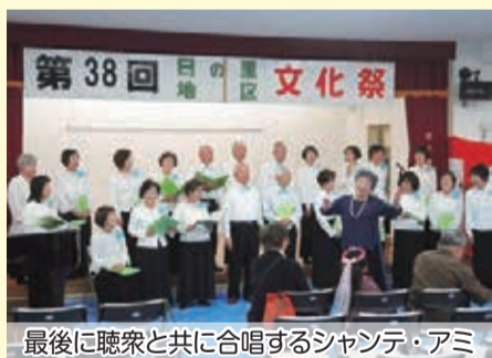
最後に聴衆と共に合唱するシャンテ・アミ