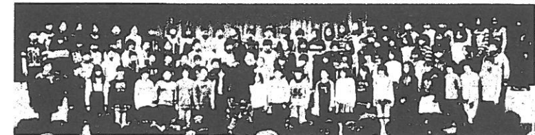
5年生合唱「大切なもの」