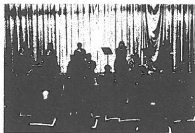
吹奏楽部演奏「風紋」他