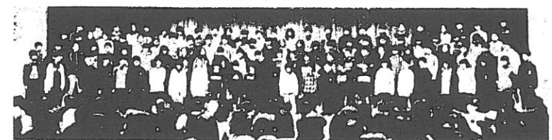
6年生合唱「この星に生まれて」