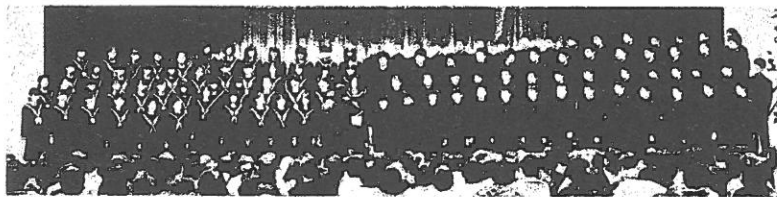
9年生学年合唱「道」「旅立ちの日に」

2月17日(金)に、日の里中学校の体育館で「9年生を送る会」が開かれました。1年生から4年生までは、ビデオでの参加となりましたが、9年生に感謝の気持ちを込めて「校歌」を送りました。そして、5年生と6年生は、西小学校と力を合わせ元気な歌声で9年生を送り出すことができました。プログラムの最後は、9年生の合唱でした。これから中学へと進学する6年生にとって、新たな目標となる素晴らしい合唱でした。