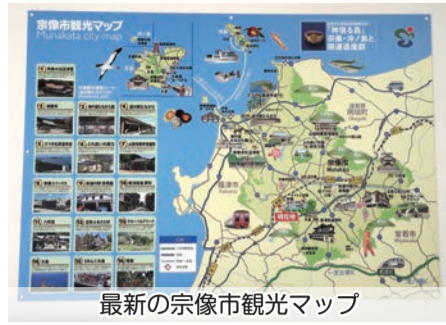
最新の宗像市観光マップ