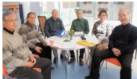
パネル展示の準備をするインフォメーショングループの皆さん

00人を超えました。現在一番うまく利用しているのが子どもたちです。今回はおとなたちにもっと自由に利用して貰えるように、インフォメーションスペース(フリースペース)にスポットを当てます。広々としたフリースペースの左手には大きな宗像市の観光地図、中央は宗像のおいしいものの販売、右手はパネル展示、そして2つの素敵なテーブルが置いてあります。飲食自由なフリースペースは無