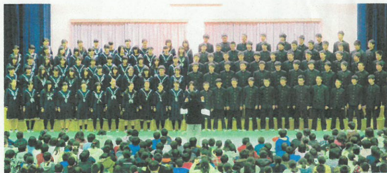
日の里中学校体育館：開場14：00