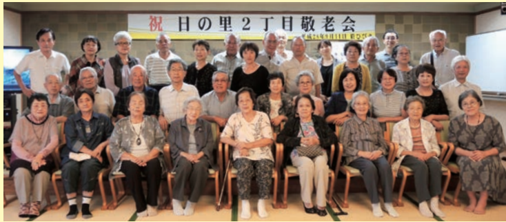
9月11日(日)開催されました。11時に2丁目公民館に集合。送迎バスで国民宿舎ひびきへ。70歳以上の該当者251人のうち35人が出席しました。当日になって体調不良で不参加の方が2人出ました。

町内会長の挨拶に引き続き食事会。海の幸を味わいながら会話を楽しみました。次はカラオケ。それぞれのを披露しました。恒例のビンゴゲーム。最後に全員の集合写真を撮って無事お開きになりました。