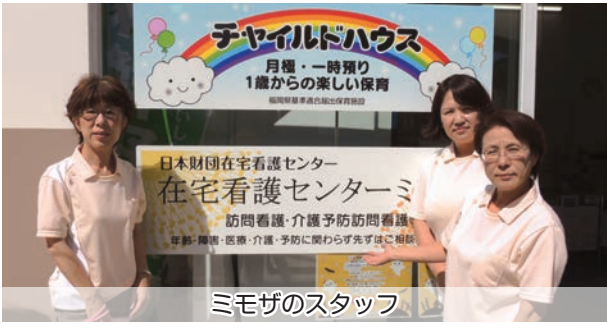
チャイルド・ハウス あ、電車がきた

ミモザは、緊急性があれば24時間、365日、症状・障害・年齢を問わず対応可能、経験豊富な3人の看護師が医師の指示を受け、医療処置・退院支援・精神的ケア・自宅での看取り、等多様に対応します。今後の高齢社会では地域で最も必要とされる機能を持つセンターと思われれます。