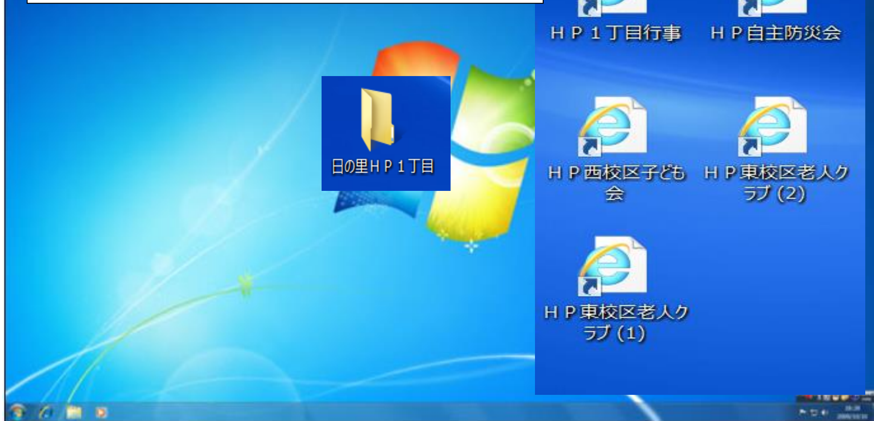
Windows7のデスクトップ画面

■ 現行HPで町内会の情報が閲覧し難いと感じる場合の対応策 所属する町内会など、の閲覧したい箇所のアイコンを予めデスク トップに 設定しておく と便利 (画像は1丁目町内会の例)