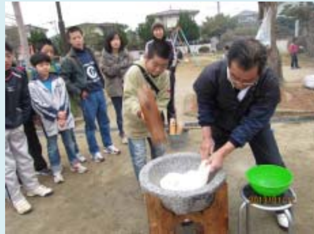
よいしょ！よいしょ！