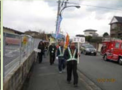
日の里一周パレード