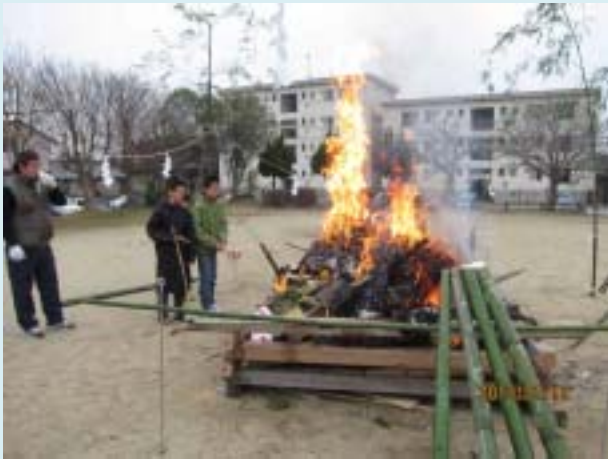
この火にあたれば一年健康！

いただいたみなさんのおかげで無事に、そして盛大に「どんど焼き」を行うことができました。ありがとうございます。今年も一年、二丁目町内会のみなさまにとって良い年になりそうですわね！