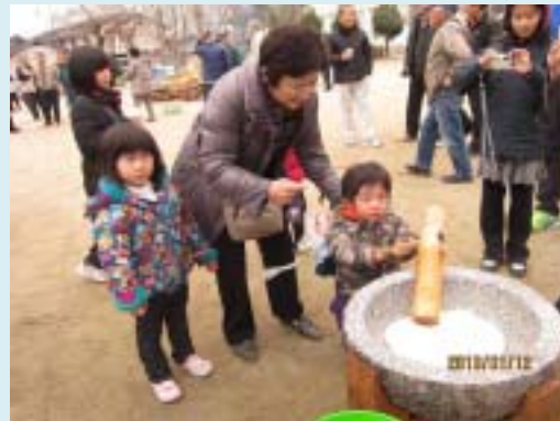
はじめてのもちつき？