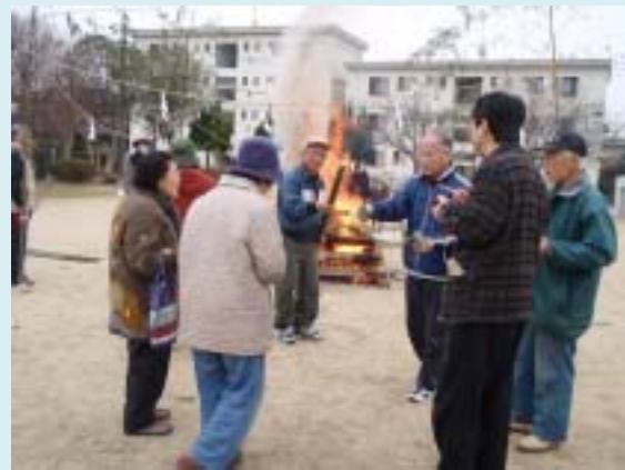
カッポ酒のふるまい

「どんど焼き」で子ども会は、豚汁を作りました。当日は天気もすくすく持ち、たくさんの子もたちや町内のみなさまが参加しました。実際のもちつきを体験するなど、子どもたちにとっても、良い経験になったと思います。例年以上に盛況で家族や子どもたち同士で楽しんでる姿を見ると、参加して良かったという気持ちになりました。このような伝統行事を子どもたちに伝えることは大切だと感じています。