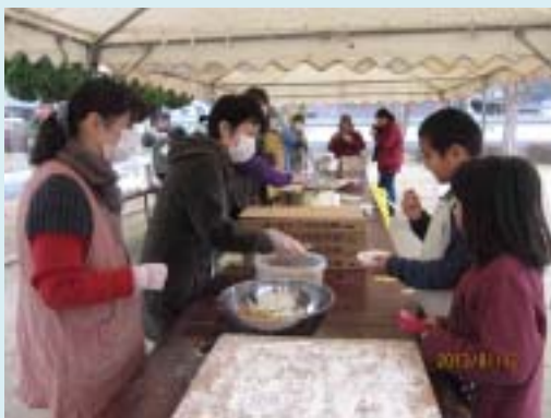
お待たせしました