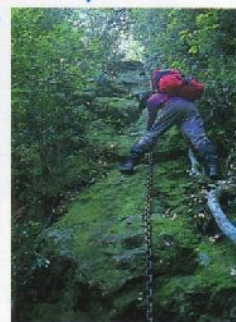
③鎖につかまって絶壁を登る