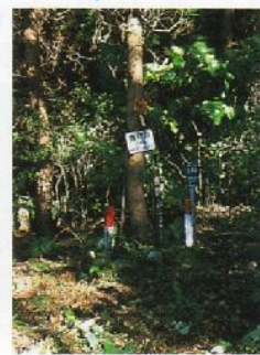
④ひっそりとした熊群山山頂