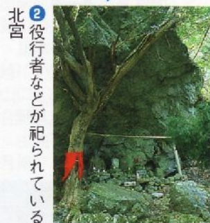
北宮 ②役行者などが祀られている