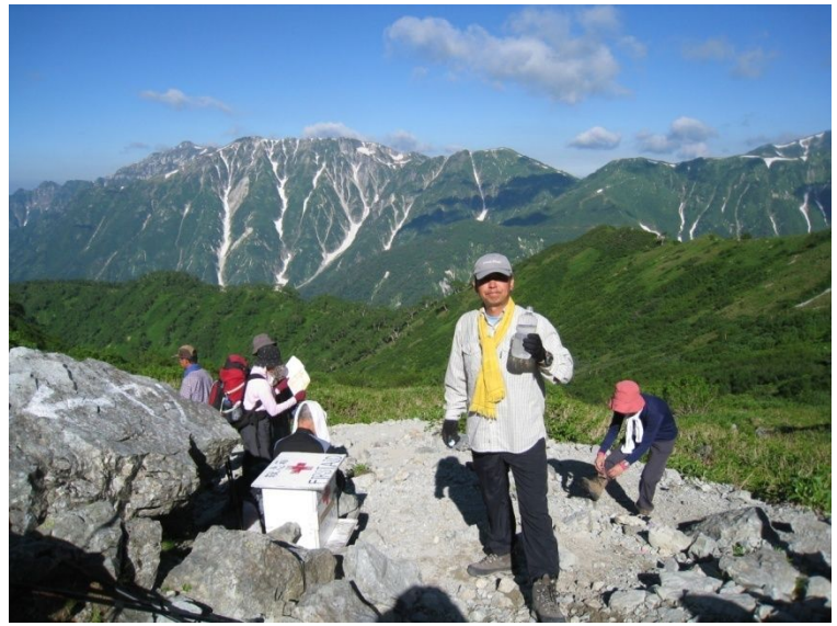
千丈乗越分岐で小休止