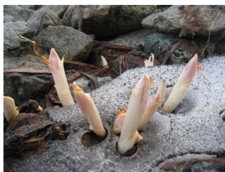
雪溪の中からの芽吹き