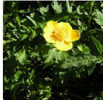
ミヤマキンポウゲ