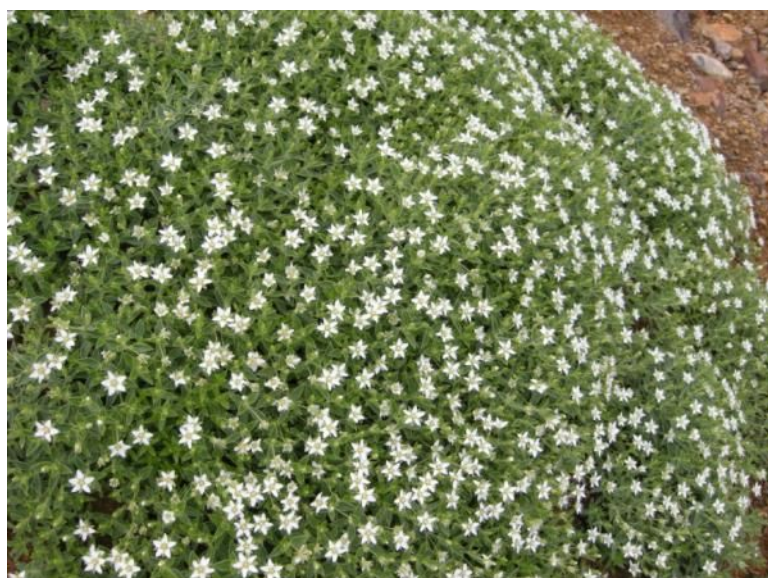
メアカンフスマ (ナデシコ科・ノミノツヅリ属)