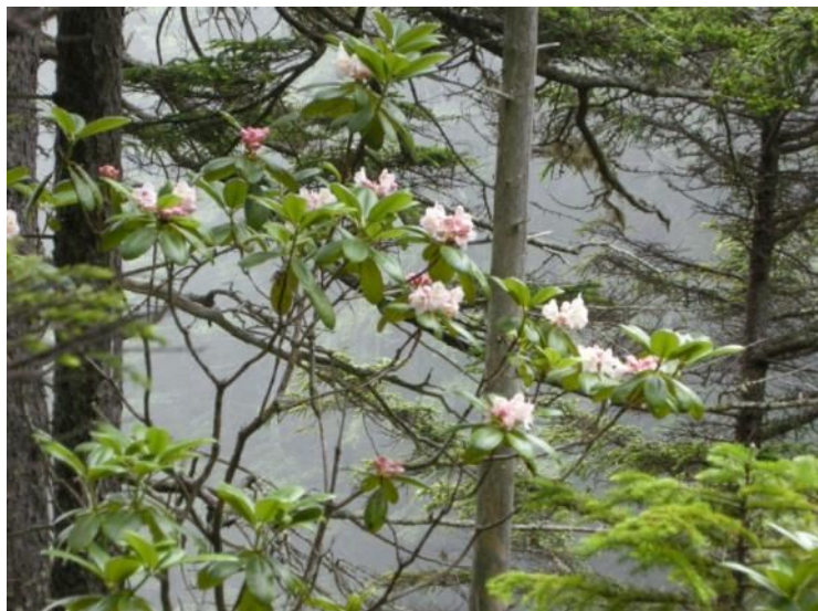
ハクサンシャクナゲ (ツツジ科・ツツジ属)