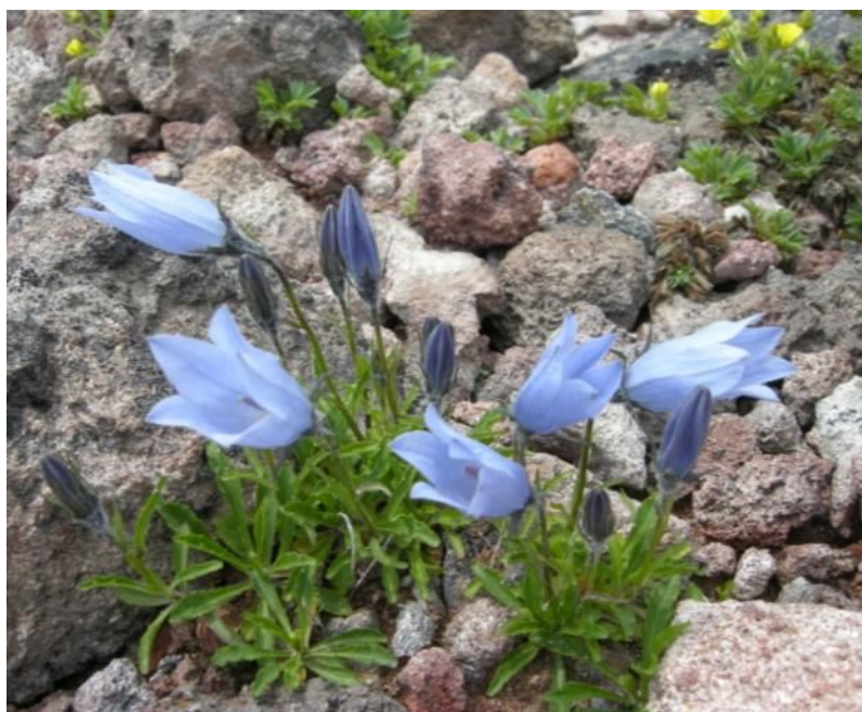
↑イワギキョウ (キキョウ科・ホタルブクロ属)