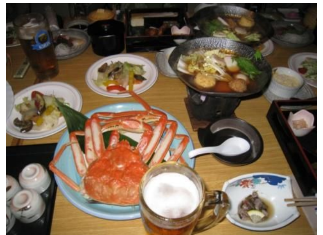
最終宿泊地「川湯温泉」の豪華夕食 ←オンネトー