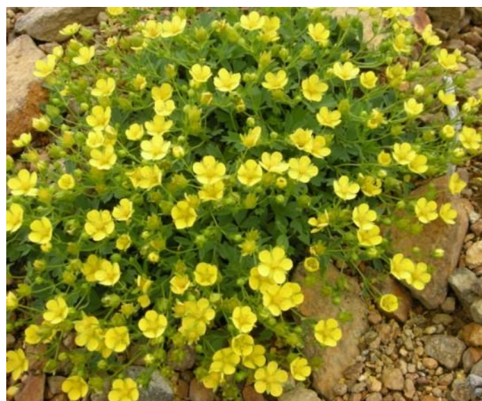
メアカンキンバイ (バラ科・キジムシロ属)