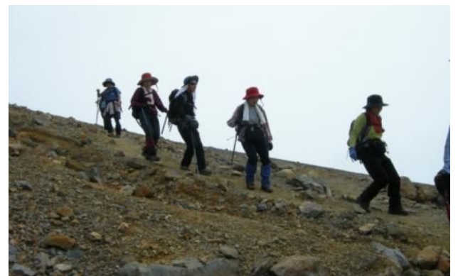
雌阿寒岳から阿寒富士を望む