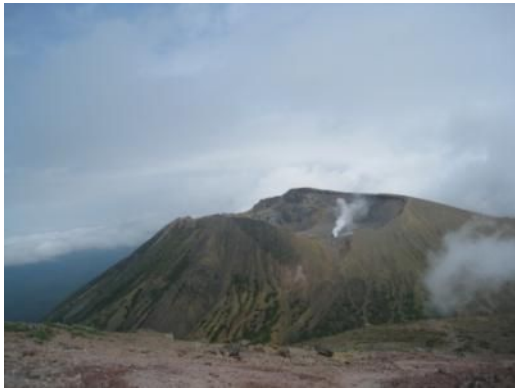
阿寒富士から雌阿寒岳を望む