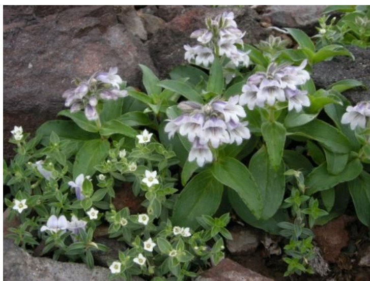
イワブクロ (上) とメアカンフスマ