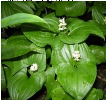
マイヅルソウ (ユリ科)