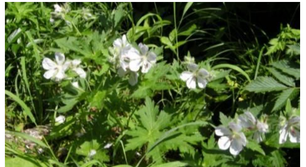
トカチフウロ (フウロソウ科)