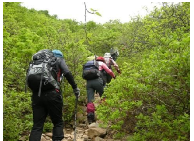
下二股から 6ヶ所の滝を見ながら上二股に 到着。ここから馬ノ背まで40分 高山植物の宝庫