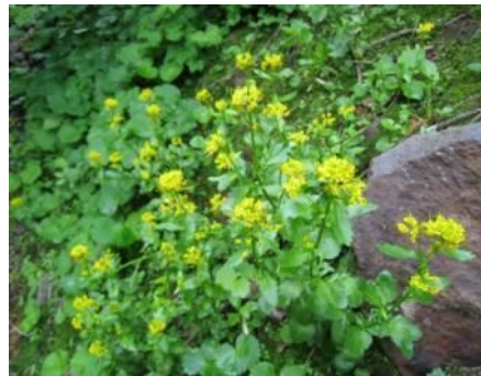
ヤマガラシ (アブラナ科)