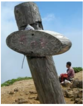
馬ノ背に到着。 ここから 30 分で頂上