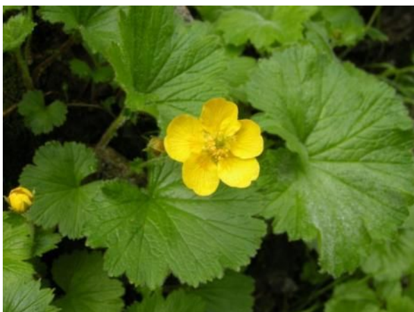
← ミヤマダイコンソウ → ミヤマエンレイソウ