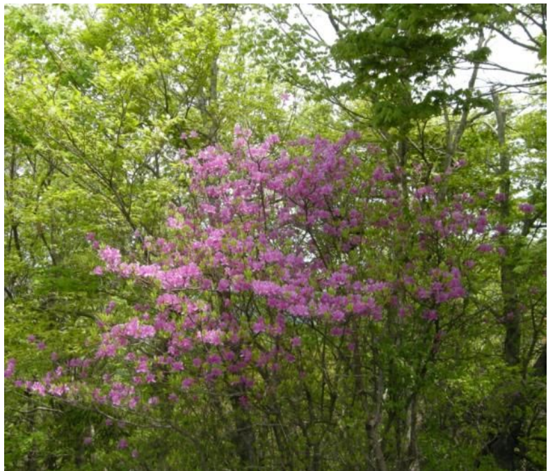
ミツバツツジ (ツツジ科・ツツジ属)