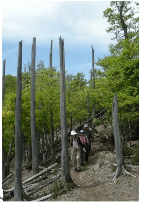
茶白山→経読岳 九州自然歩道