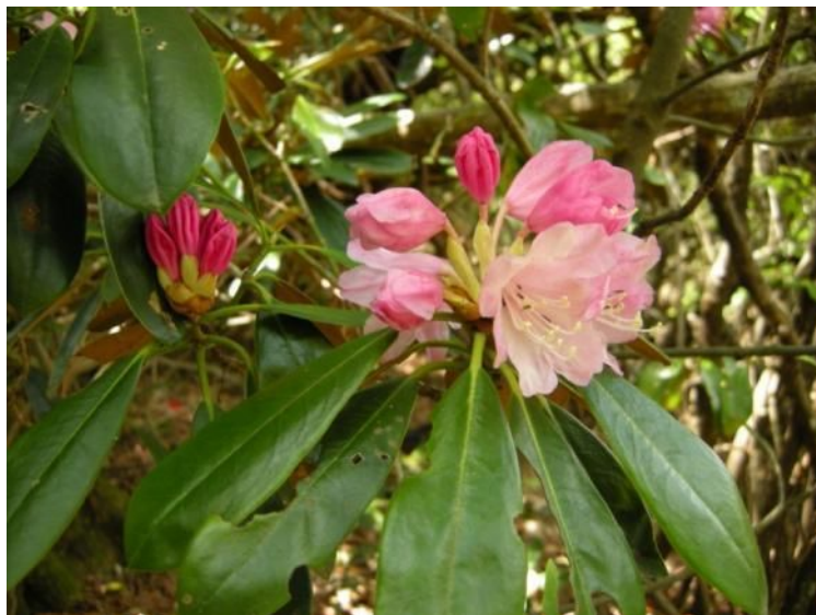
笈吊峠に咲くホンシャクナゲ（ツツジ科・シャクナゲ属）