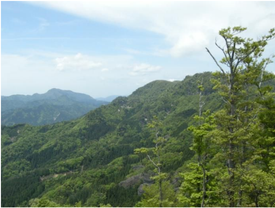
茶白山からの展望