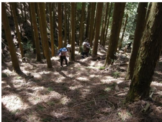
人工林の急登を登る。