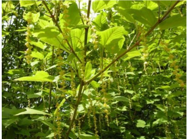
コナラ (ブナ科・コナラ属)