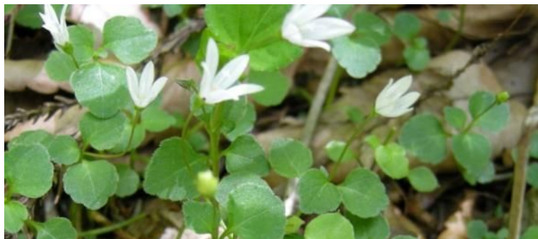
タニギツキョウ（キキョウ科・タニギツキョウ属）