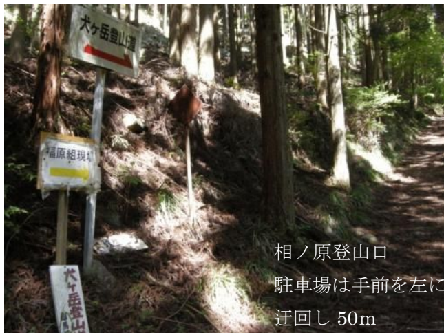
相ノ原登山口 駐車場は手前を左に 迂回し 50m