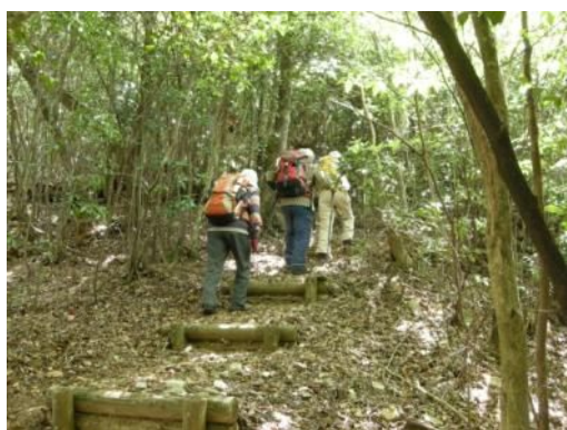
階段を上って尾根筋に出るとシャクナゲの道が続く