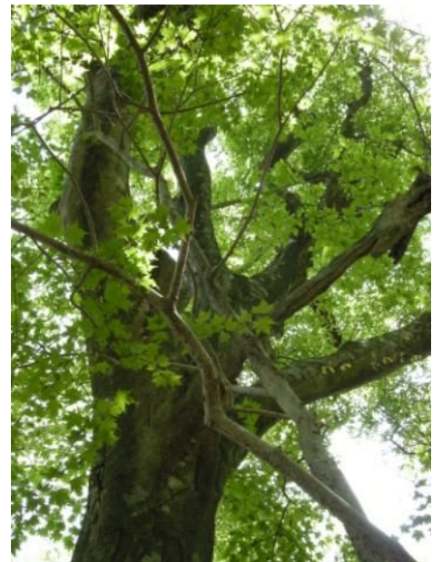
コハウチワカエデ (カエデ科・カエデ属)