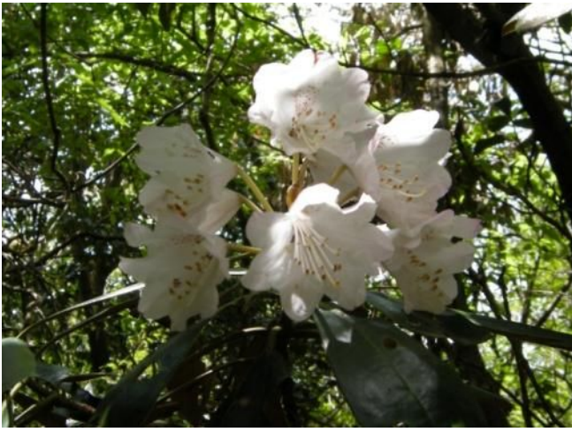
珍しい白花のホンシャクナゲ