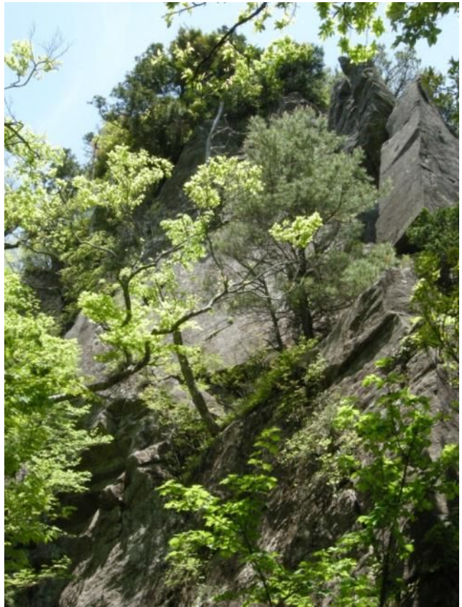
巨石の左を迂回して行くと 10 分で山頂