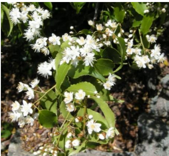
ハイノキ (ハイノキ科・ハイノキ属)