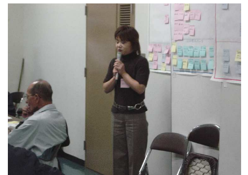
和気あいあいのグループ発表