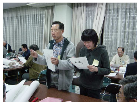
グループ内での他己紹介