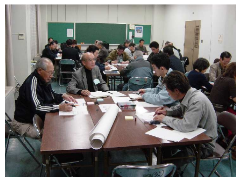
メンバーどうしのインタビュー